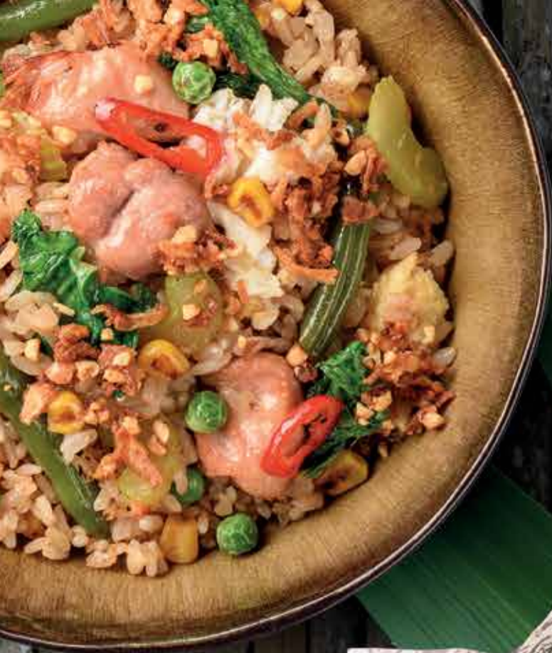
Рис Пад Тай 317.–

Рис с курицей, яйцом и овощами (фасоль, горошек, кукуруза, сельдерей, шпинат, пекинская капуста, перец чили, чеснок, дробленые орехи) в соусе Пад Тай